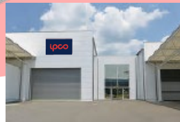
オフィス・部品倉庫